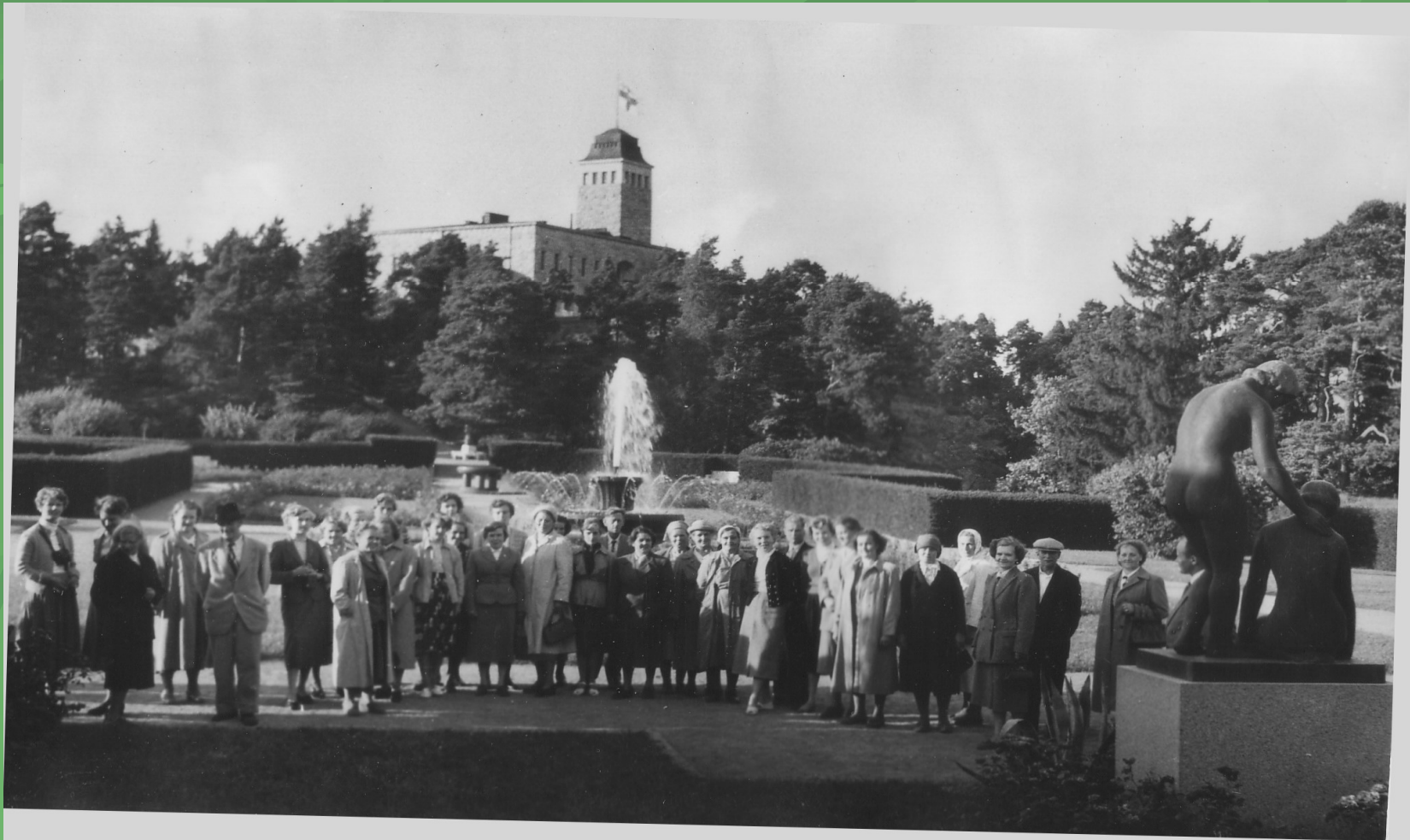
Sammatin Maatalousnaiset retkellä Naantalissa 1950-luvulla